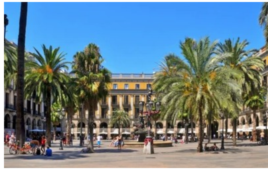
Plaza Real :