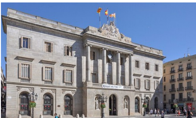
Plaza del ayuntamiento y de la Generalitat :