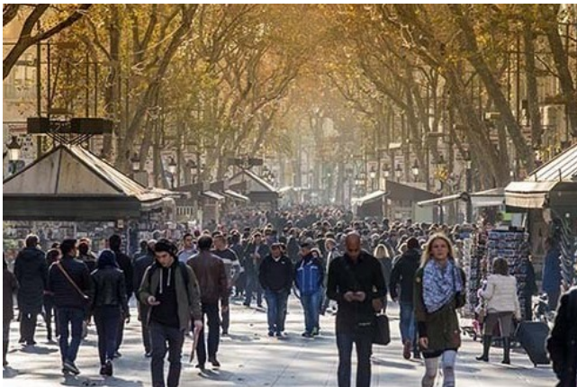
La Rambla :