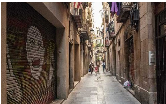
Le Barri Gotic :