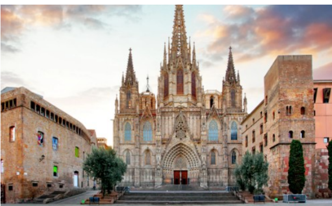
Cathédrale de Barcelone :