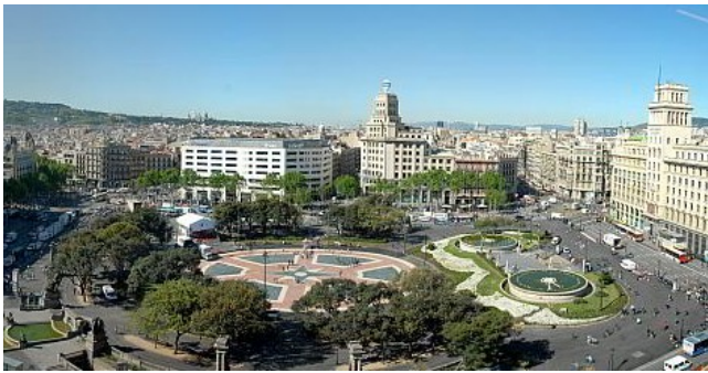
Plaza Catalunya :