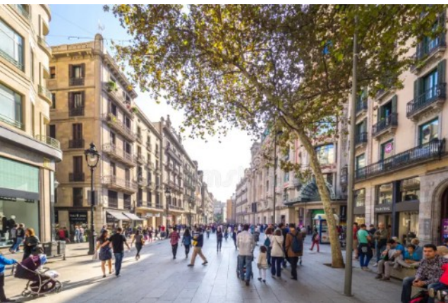
Avenida del Portal del Angel (commerces) :